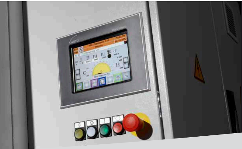
Touch Screen KASTO BasicControl.